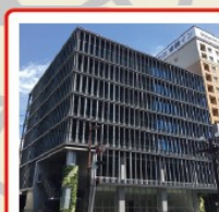
TKPガーデンシティ 鹿児島中央 鹿児島県鹿児島市中央町26-1 南園アネックス 2F/3F